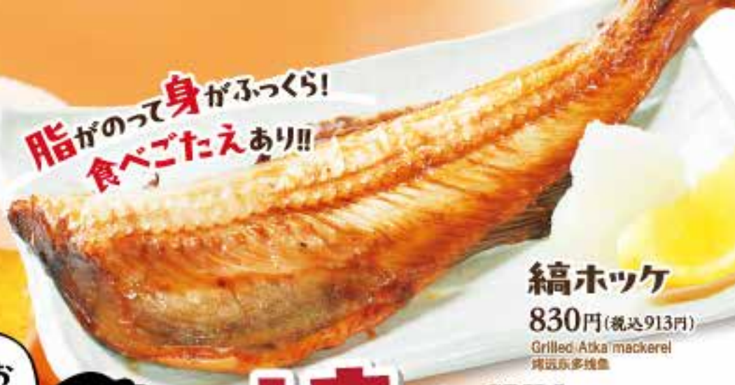
縞ホッケ 830円(税込913円) Grilled Atka mackerel 縞近江多摩産