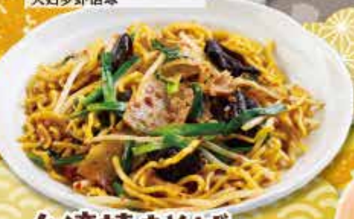
台湾焼きそば 750円 (税込825円) Piquantly spicy fried noodles 超辣味的炒面