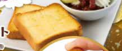
小倉トースト 590円 (税込649円) Toast with red bean paste and butter 小倉吐司