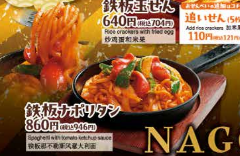
鉄板ナポリタン 860円 (税込946円) Spaghetti with tomato ketchup sauce 铁板那不勒斯风意大利面