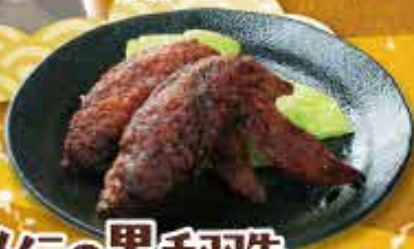
秘伝の黒手羽先 390円 (税込429円) Sauce-flavored deep-fried chicken wings 酱味炸鸡翅

おせんべい追加はコチラ 追いせん (5枚) Add rice crackers 加米菓 110円 (税込121円)