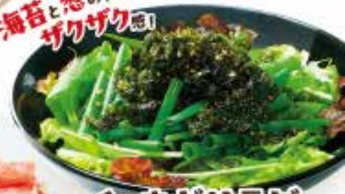
チョネギサラダ 530円(税込583円) Chorenegi salad with small green onions 韩式沙拉