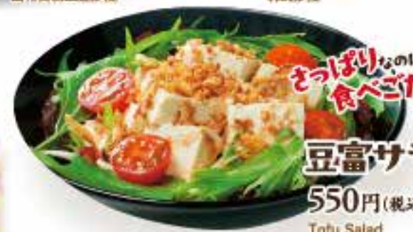
たっぷりなのにお 食べごたえあり! 豆腐サラダ 550円(税込605円) Tofu Salad 豆腐沙拉