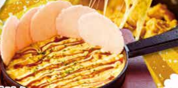
鉄板玉せん 640円 (税込704円) Rice crackers with fried egg 炒鸡蛋和米菓

おせんべい追加はコチラ 追いせん (5枚) Add rice crackers 加米菓 110円 (税込121円)