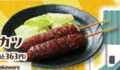
みそ串カツ 330円 (税込363円) Deep-fried pork skewers in red miso sauce 炸猪肉串浇味噌