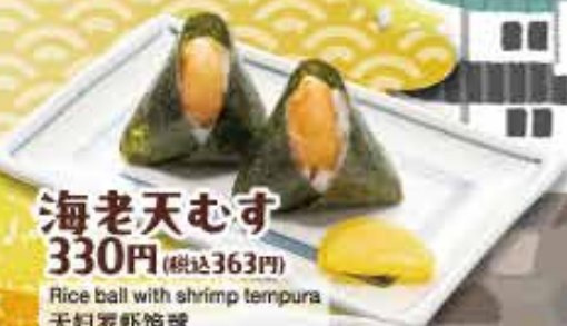
海老天むす 330円 (税込363円) Rice ball with shrimp tempura 天妇罗虾饭球