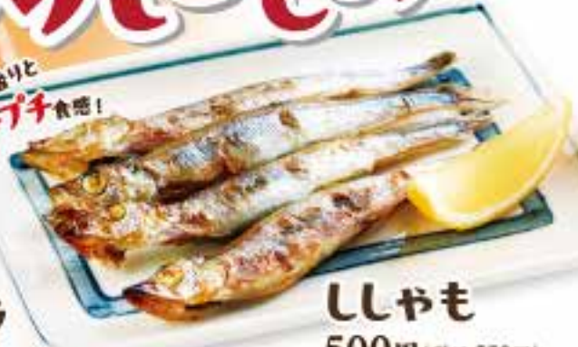
ししやも 500円(税込550円) Grilled shishamo smelt 地産豊後産