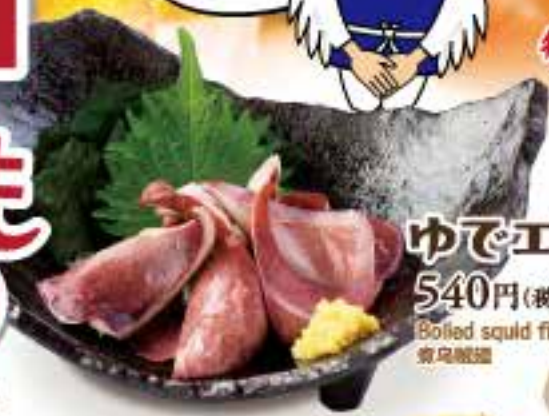
ゆでエンペラ 540円(税込594円) Boiled squid fin 青島産