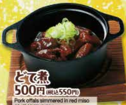
どれ煮 500円 (税込550円) Pork offals simmered in red miso 味噌炖猪肉脏