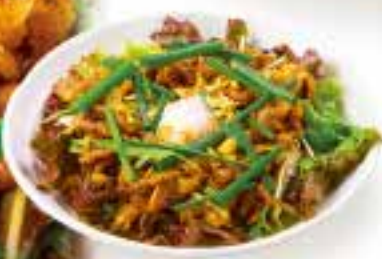
焼肉温玉サラダ 860円(税込946円) Grilled meat and hot spring egg salad 烤肉温泉鸡蛋沙拉